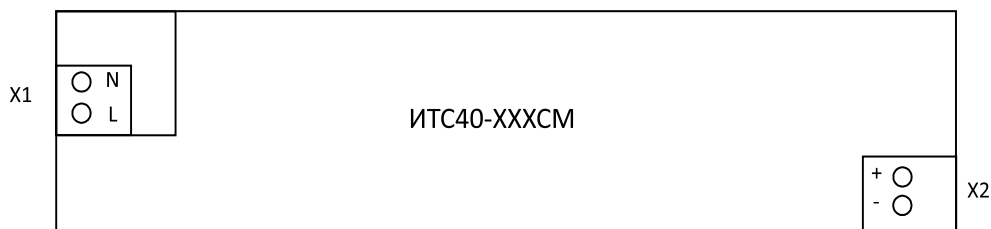
Рисунок 1. Внешний вид изделия

ИТС состоит из печатной платы с радиоэлементами. Для коммутации на печатной плате выведены клеммы. Внешний вид расположения клемм или проводов показаны на рисунке №1.